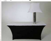
Buffettafel (prijs is excl. lamp)

Statafel Ø 85 cm Terrastafel Ø 85 cm Dinertafel Ø 120,150,180 Buffettafel 180 cm x 70 cm Buffettafel compleet met stretchrok en linnen (zwart / wit) Klapstoel gestoffeerd